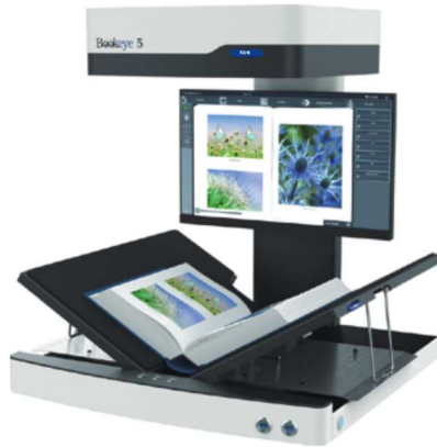
クレイドル:Vポジション