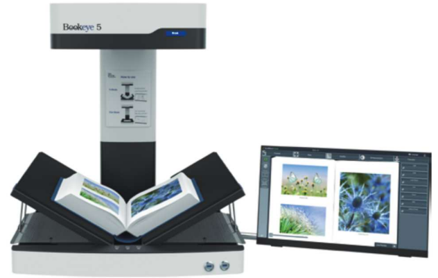
プレビューモニター:横置き