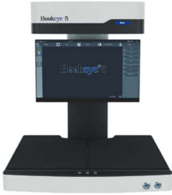
クレイドル:フラットポジション